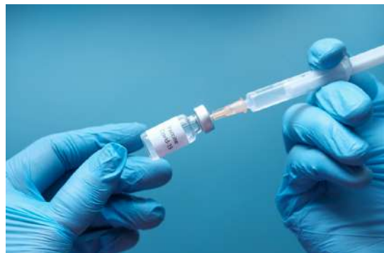
Philippines : Amélioration du système de santé pour traiter et limiter la COVID-19

Suivez-nous sur nos différents réseaux sociaux