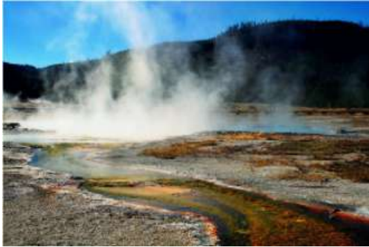
Indonésie : Projet de production d'énergie géothermique