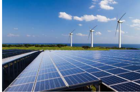
Vanuatu : Projet d'accès à l'énergie