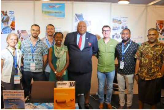
Visite du stand NCT&I par le président Fidjien, Ratu Wiliame Katonivere et le ministre du commerce, du tourisme et du transport, Faiyaz Koya